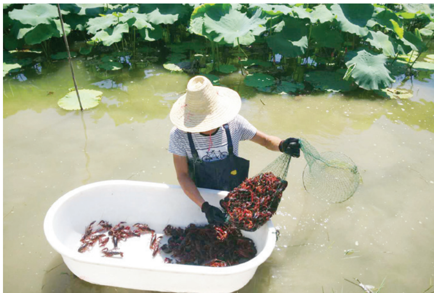
2018年8月9日,柳江区成团白露小龙虾养殖基地养殖户捕捞小龙虾

【柳东新区个体私营经济】 2018年,柳州市柳东新区(含阳和工业新区)有个体工商户7654户,从业人员1.72万人,注册资本7.38亿元;新增个体工商户1577户,从业人员3870人,注册资本1.7亿元。有私营企业3391家,从业人员2.36万人,注册资本362.89亿元;新