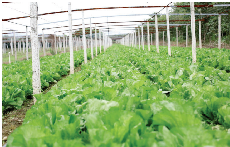
2018年5月18日,柳北区石碑坪镇石碑村大棚蔬菜基地