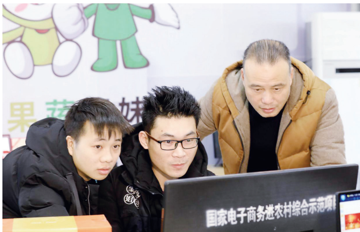
2018年1月31日,市融安县某电商企业工作人员在分析金桔销售数据