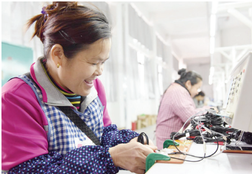
2018年4月1日,三江侗族自治县古宜镇南站社区旭升电子厂工人正在检测数据线

私营企业行业分布 2018年,融水苗族自治县私营企业主要分布在18个行业。其中,农林牧渔业709户,占总户数24.6%;采矿业33户,占1.1%;制造业255户,占8.9%;电力、燃气及水的生产和供应业61户,占2.1%;建