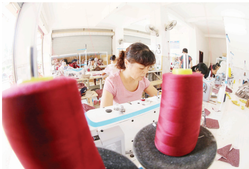
2018 年 8 月 17 日,融安县扶贫小微工厂工人正在进行作业

私营企业行业分布 2018 年,融安县私营企业主要分布在 17 个行业。其中,批发和零售业 655 家,占总数 35.4%;农林牧渔业 464 家,占 25.1%;住宿和餐饮业 15 家,占 0.8%;制造业 146 家,占 7.9%;租赁和商务服务业 155 家,占 8.4%;建筑业 69 家,占 3.7%;电力、燃气和水生产及供应 15